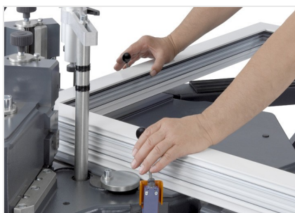
Máquina de cravar cantos EP 124/20