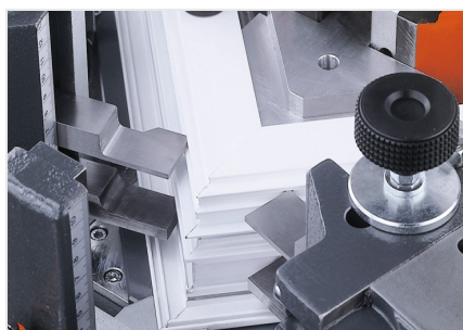
Máquina de cravar cantos EP 124