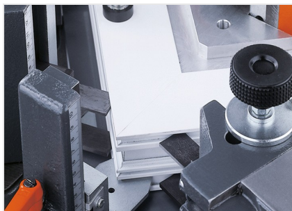
Máquina de cravar cantos EP 124