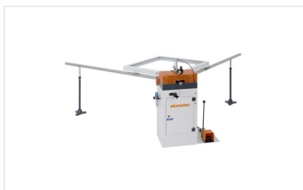
Máquina de cravar cantos EP 120