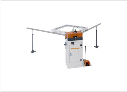
Máquina de cravar cantos EP 120