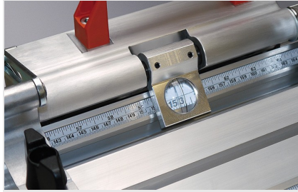
Sistema de batente e medição AMS 200