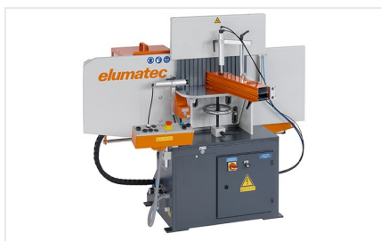
Fresa de malhetar AF 223/01