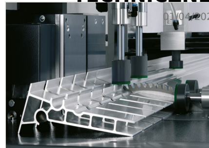
Automat do cięcia SAS 142/44