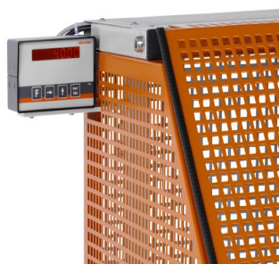
Automat do cięcia SA 73/36