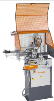
Automat do cięcia SA 73/36