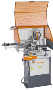
Automat do cięcia SA 73/36