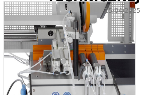
Automat do cięcia SA 73/36