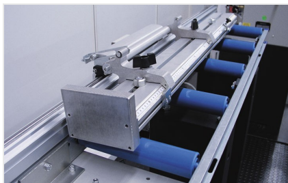
System pomiarowy MMS 200