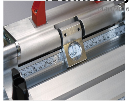
System pomiarowy MMS 200