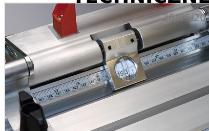
System pomiarowy MMS 200