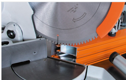
Piła obrotowa MGS 73/33