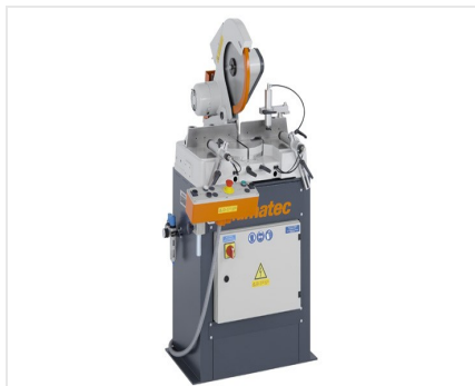
Piła obrotowa MGS 73/33