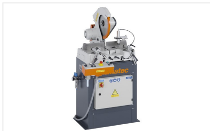
Piła obrotowa MGS 73/33