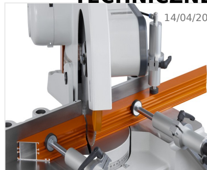
Piła obrotowa MGS 73/33