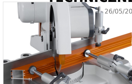
Piła obrotowa MGS 73/33