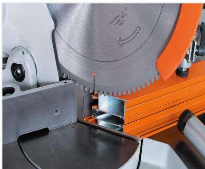
Piła obrotowa MGS 73/33