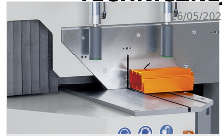
Piła obrotowa MGS 105