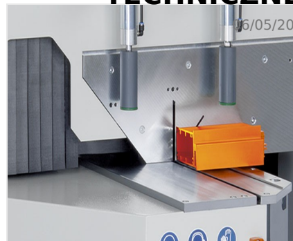
Piła obrotowa MGS 105