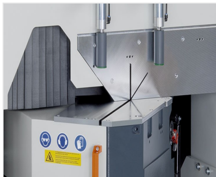
Piła obrotowa MGS 105