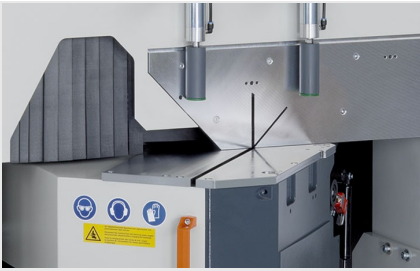
Piła obrotowa MGS 105