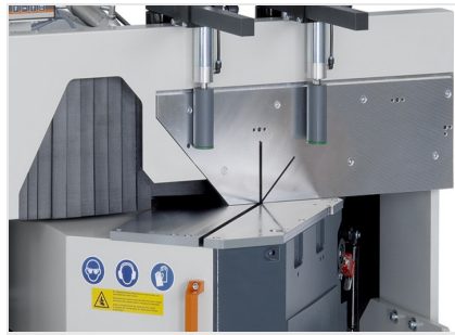
Diagram cięcia DG 105