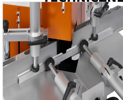
Piła do wycięć klinowych KS 101/30