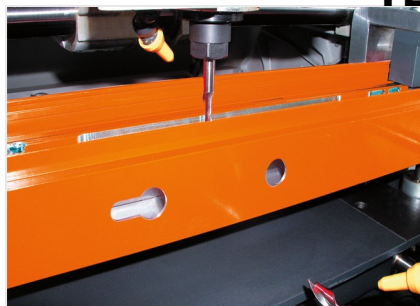
Dwuwrzecionowa frezarko-kopiarka KF 78/23

elumatec AG Pinacher Straße, 61 75417 Mühlacker Germany