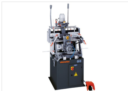
Dwuwrzecionowa frezarko-kopiarka KF 78/23