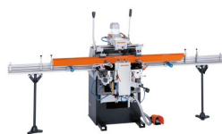
Trójwrzecionowa frezarko- kopiarka KF 178/10