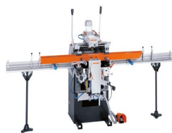
Trójwrzecionowa frezarko- kopiarka KF 178/10