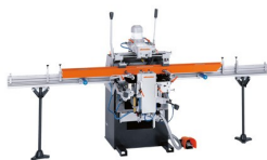
Trójwrzecionowa frezarko- kopiarka KF 178/10