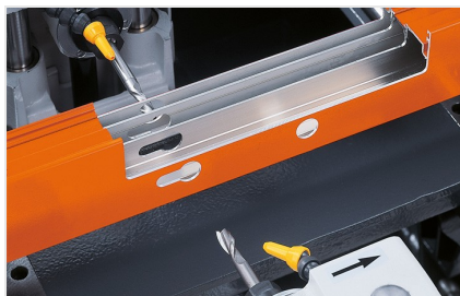
Trójwrzecionowa frezarko- kopiarka KF 178/10