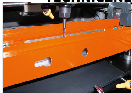
Trójwrzecionowa frezarko- kopiarka KF 178/10