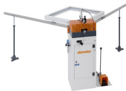
Zaciskarka do naroży EP 120