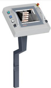
Komputer sterujący E 580