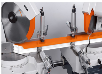
Piła dwugłowicowa DG 79