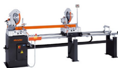
Piła dwugłowicowa DG 79 DG 79 + E 111