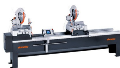
Piła dwugłowicowa DG 79 M