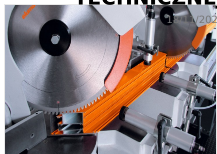
Piła dwugłowicowa DG 79