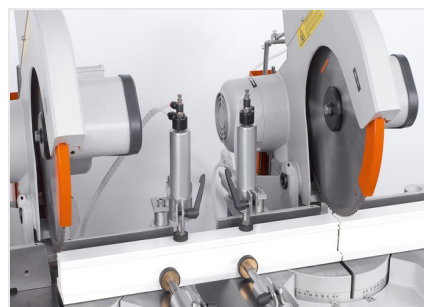
Piła dwugłowicowa DG 79