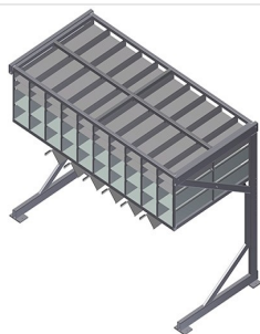
Regał na okucia BR 40