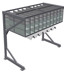
Regał na okucia BR 40