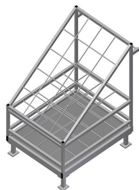
Wózek na wzmocnienia AW 1100