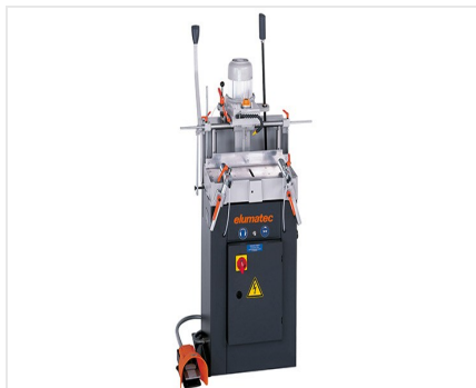
Jednowrzecionowa frezarko-kopiarka AS 70/44