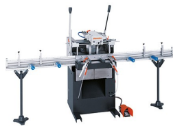
Jednowrzecionowa frezarko-kopiarka AS 170