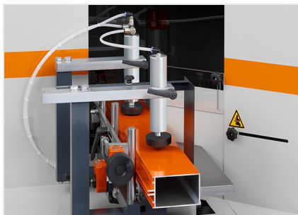
Piły do wycięć klinowych AKS V-550