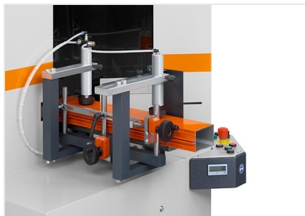
Piły do wycięć klinowych AKS V-550