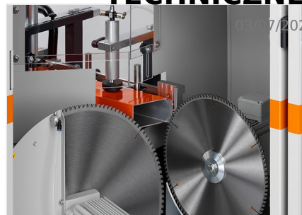
Piły do wycięć klinowych AKS V-550