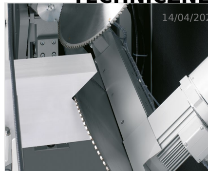
Piły do wycięć klinowych AKS 134/64