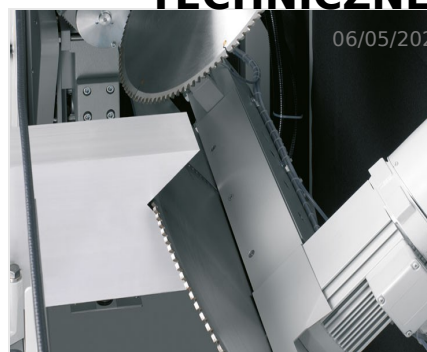
Piły do wycięć klinowych AKS 134/64