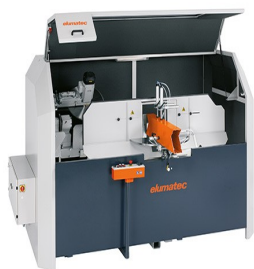
Piły do wycięć klinowych AKS 134/64