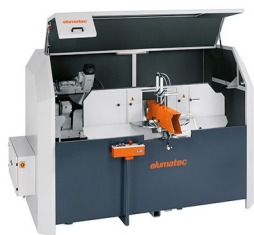
Piły do wycięć klinowych AKS 134/64