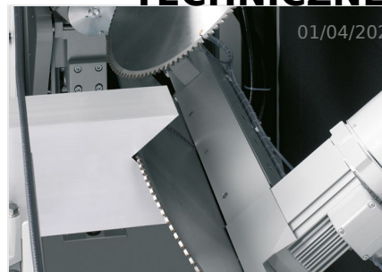
Piły do wycięć klinowych AKS 134/64