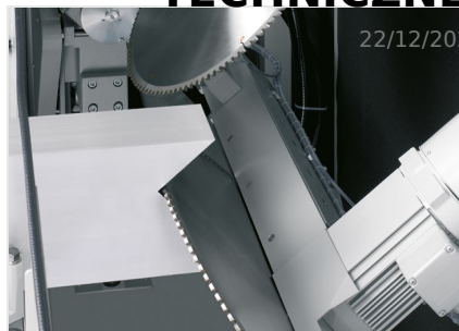
Piły do wycięć klinowych AKS 134/64