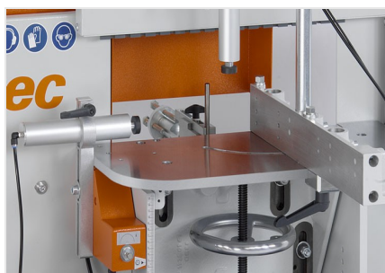
Frezarka do słupków AF 223/01