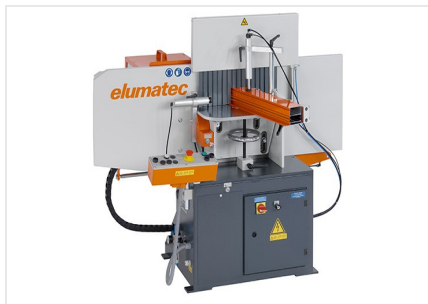
Frezarka do słupków AF 223/01