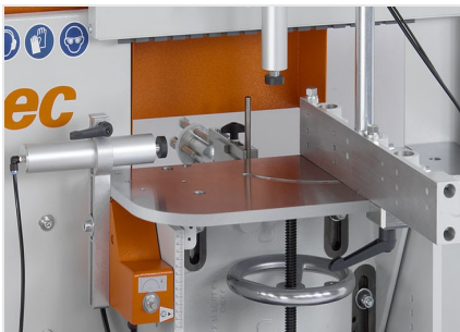
Frezarka do słupków AF 223/01