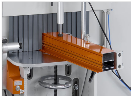
Frezarka do słupków AF 223/01