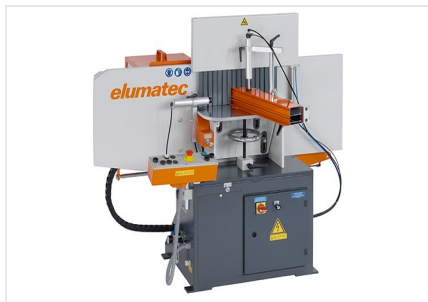
Frezarka do słupków AF 223/01