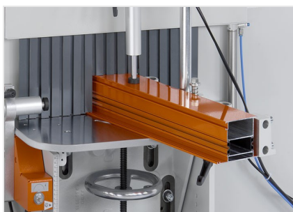
Frezarka do słupków AF 223/01