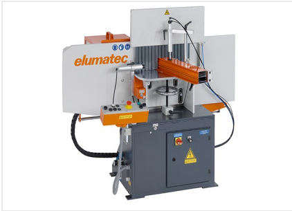
Frezarka do słupków AF 223/01