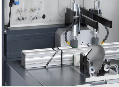
Zaagautomaat SAS 142/43