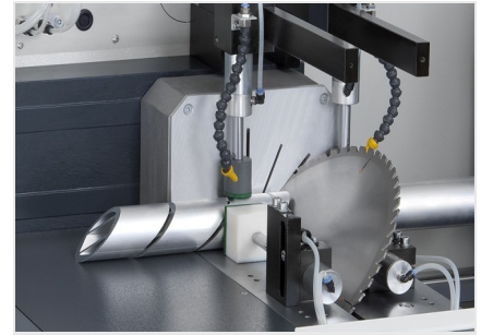
Zaagautomaat SAS 142/43