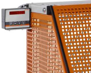
Zaagautomaat SA 73/36