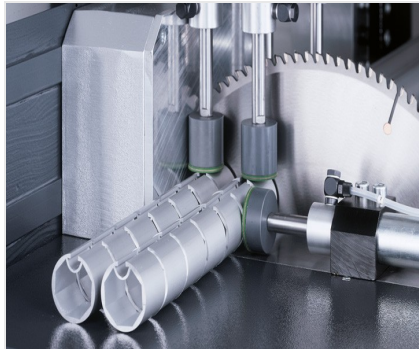
Zaagautomaat SA 142/37