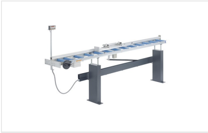
Aanslag- en meetsysteem MMS 200