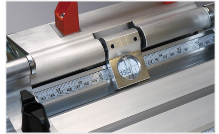
Aanslag- en meetsysteem MMS 200