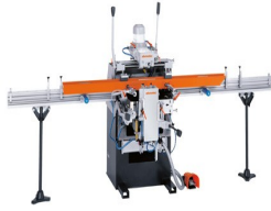
Driespindel- kopieerfreemACHINE KF 178/10