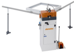
Hoekverbindingspers EP 120