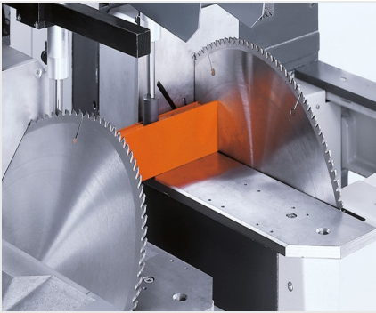
02. Dubbele verstekzaagmachine DG 142 XL