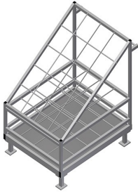
Staalverstevigingswagen AW 1100