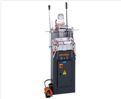
Éénspindel- kopieerfreesmchine AS 70/44