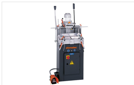
Ééenspindel- kopieerfreemachine AS 70/44