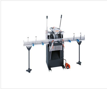
Éénspindel- kopieerfreemACHINE AS 170/10