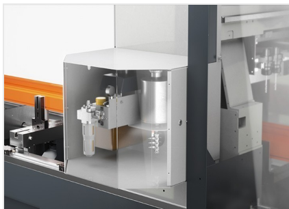
Centro di lavoro SBZ 141