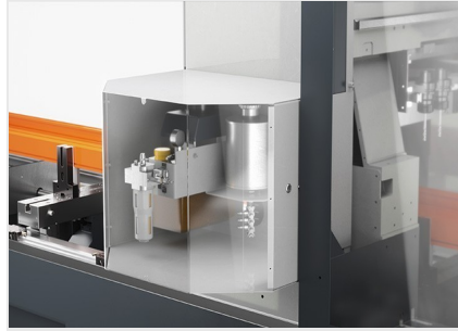
Centro di lavoro SBZ 141