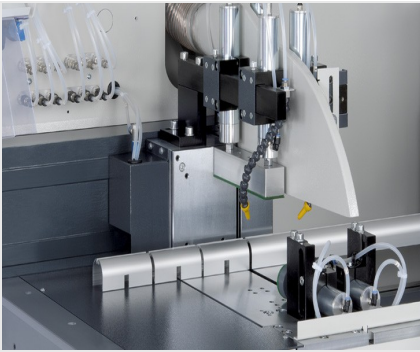
Troncatrice automatica SAS 142/44