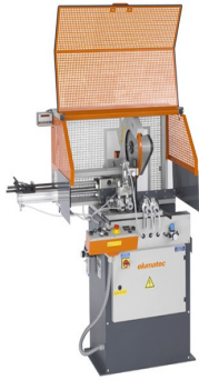
Troncatrice automatica SA 73/36