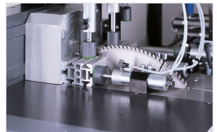
Troncatrice automatica SA 142/37