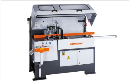
Troncatrice automatica SA 142/37