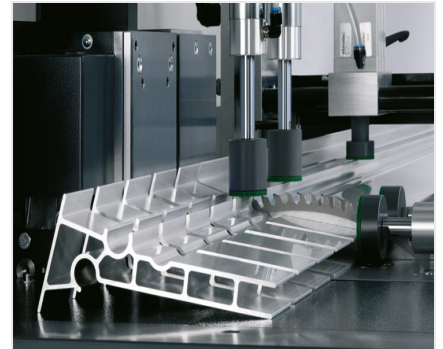
Troncatrice automatica SA 142/37