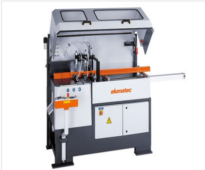
Troncatrice automatica SA 142/37