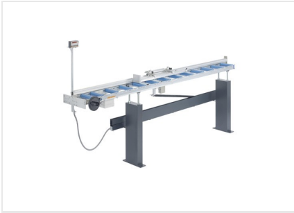
Sistema di battuta e misurazione MMS 200