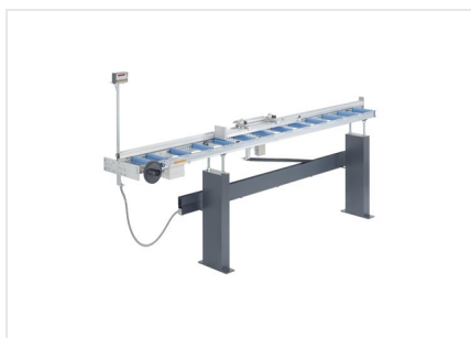
Sistema di battuta e misurazione MMS 200