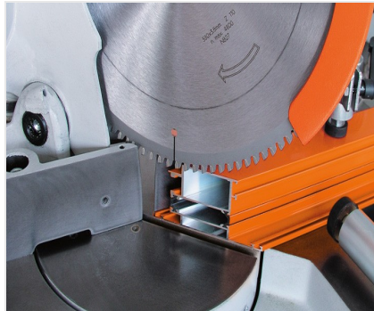
Troncatrice per tagli obliqui MGS 73/33