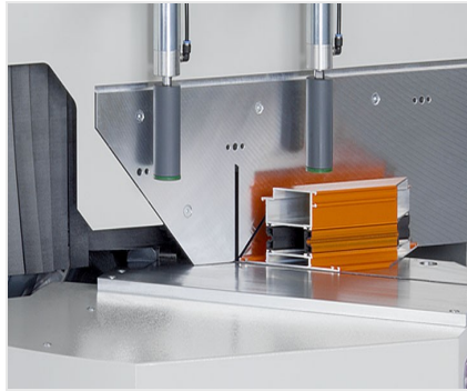
Troncatrice per tagli obliqui MGS 105