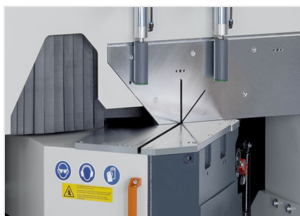
Troncatrice per tagli obliqui MGS 105