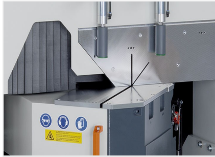
Diagramma di taglio MGS 105