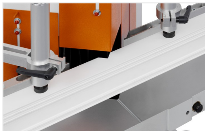
Sega per taglio di cunei e troncatrice a due lame KS 101/30