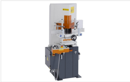
Sega per taglio di cunei e troncatrice a due lame KS 101/30