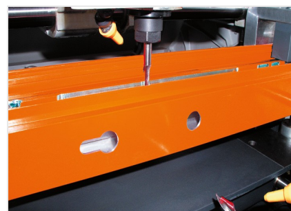
Pantografo a 3 mandrini KF 178/10