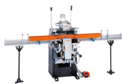
Pantografo a 3 mandrini KF 178/10