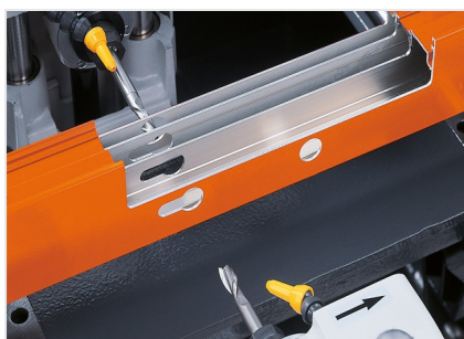
Pantografo a 3 mandrini KF 178/10