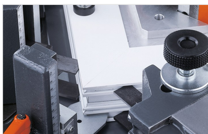
EP 124 Cianfrinatrice per angoli