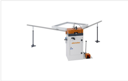
Cianfrinatrice per angoli EP 120