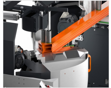
Troncatrice bilama DG 104