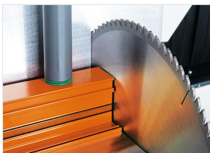
Troncatrice bilama DG 104