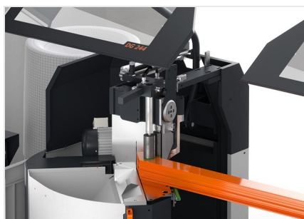
Troncatrice bilama DG 104