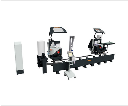
Troncatrice bilama DG 104 + E 590