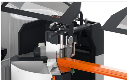
Troncatrice bilama DG 104