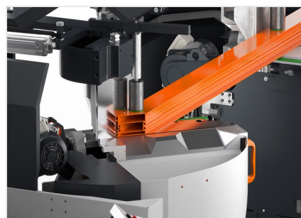
Troncatrice bilama DG 104