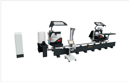
Troncatrice bilama DG 104 + E 590