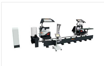
Troncatrice bilama DG 104 + E 590